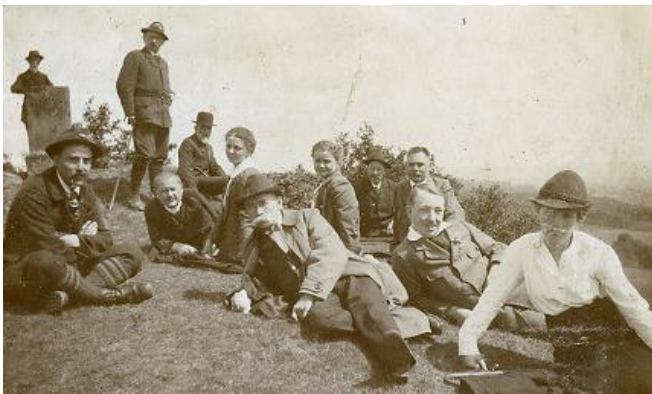
Abb. 6: Foto vom Frauenberg aus dem Jahr 1916 – links hinten ist der Gerling'sche Steinpfeiler aus südlicher Richtung zu erkennen

Auf zwei alten Fotos aus dem Jahr 1916 (Abbildung 6) und aus der Zeit um 1935 (Abbildung 7) – beide aus [5] LAGIS 2011 entnommen – war zu erkennen, dass der Pfeiler zur jeweiligen Zeit deutlich weiter als 0,83 m aus dem Boden herausgeragt hat; Messungen in diesen Bildern deuteten auf einen Wert von 1,10 m bis 1,30 m hin. Möglicherweise war im davor liegenden Zeitraum auch Erde vom Plateau des Frauenberges abgetragen worden. Dies hätte eine Verminderung der ursprünglichen Standfestigkeit des Pfeilers zur Folge gehabt, weshalb er später auch umgestürzt werden konnte.