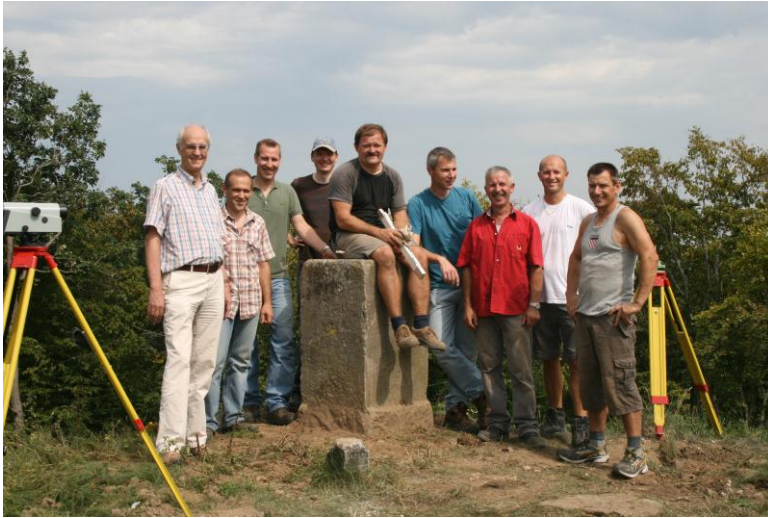
Abbildung 9: Der Steinfeiler auf dem Frauenberg nach seiner originalgetreuen Wiederherstellung durch die HVBG am 23. August 2011

Marburg und des HLBG zusammensetzte, brachte das tonnenschwere Objekt wieder zentimetergenau an seine alte Stelle ein (siehe Abbildung 9). Dabei wurden die Steinflächen so ausgerichtet, dass die Jahreszahl 1837 nach Osten weist.