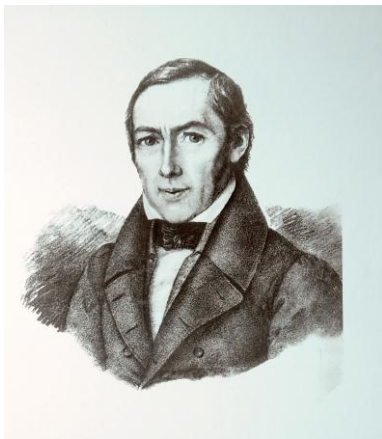
Abb. 1: Christian Ludwig Gerling (1788 – 1864)

Christian Ludwig Gerling (* 10.07.1788 – † 15.01.1864), ein Schüler des berühmten Mathematikers Carl Friedrich Gauß (* 30.04.1777 – † 23.02.1855), war von 1817 bis zu seinem Tod im Jahre 1864 Professor für Mathematik, Physik und Astronomie an der Universität Marburg. Während dieser Zeit zeichnete er für die Einrichtung der kurhessischen Haupttriangulation verantwortlich, mit der zwischen 1822 und 1837 im dortigen Hoheitsgebiet erstmals eine einheitliche, auf wissenschaftlicher Basis beruhende geodätische Grundlage für die topografischen Karten und für die Grundstücksvermessung geschaffen wurde ([2] GERLING 1839). Bei seinen astronomischen Tätigkeiten widmete sich Gerling insbesondere der verbesserten Bestimmung von Sternpositionen sowie der Nutzung von Sternpositionsmessungen für Zeit- und Ortsbestimmungen.