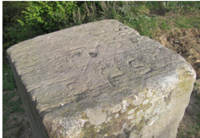
Abb. 3 und 4: Der Gerling'sche Steinpfeiler von 1837 auf dem Plateau des Frauenberges. Beide Aufnahmen entstanden nach der Wiederherstellung im Jahre 2011.

Der Steinpfeiler auf dem Frauenberg von 1837 war gleichzeitig Trigonometrischer Punkt (TP) II. Klasse der Gerling'schen Haupttriangulation von Kurhessen und somit auch eine wichtige Beobachtungsstation der Landesvermessung. Er diente zwischen 1840 und 1855 als Anschlusspunkt für die Bestimmung von kurhessischen TP III. und IV. Klasse in dieser Region. Aus heutiger Sicht stellt dieser mächtige Steinpfeiler ein kulturhistorisch wertvolles astronomisch-geodätisches Kleindenkmal dar, an dessen originalgetreuer Erhaltung und Pflege ein öffentliches Interesse besteht.