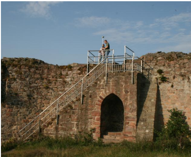
Abb. 10: Burgruine Frauenberg – Aufgang zur Aussichtsplattform

Aus Standsicherheitsgründen ragt der Steinfeiler jetzt nur noch 1,10 m aus dem Boden heraus. Das ist zwar mehr als nach den relativen Angaben von 1857, aber weniger als die Fotos von 1916 und 1935 zeigen. Die Kopffläche des Steinfeilers liegt heute bei 380,27 m über NHN, was absolut gesehen wohl einige Dezimeter niedriger ist als im Originalzustand von 1837. Dennoch ist die Wiederherstellung des 175 Jahre alten Gerling'schen Steinfeilers auf dem Frauenberg insgesamt mit einer sehr hohen Authentizität gelungen – ganz im Sinne des Denkmalschutzes und der Denkmalpflege.