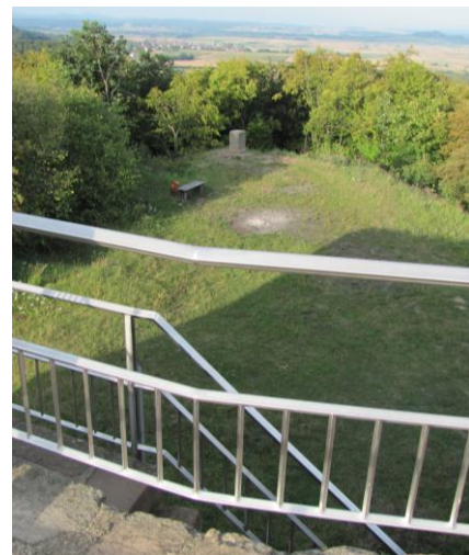
Abb. 11: Blick von der Burgruine auf das Plateau mit dem Steinfeiler

Um die Erhaltung dieses bedeutenden astronomisch-geodätischen Kleindenkmals wird sich in Zukunft auch der 2010 gegründete und in Marburg ansässige Gerling-Förderverein „Parallaxe und Sternzeit“ ( www.parallaxe-sternzeit.de ) ehrenamtlich kümmern. Der Frauenberg wird dort gerne als „Open-Air-Planetarium“ für populär-wissenschaftliche Veranstaltungen mit astronomischem Hintergrund genutzt.