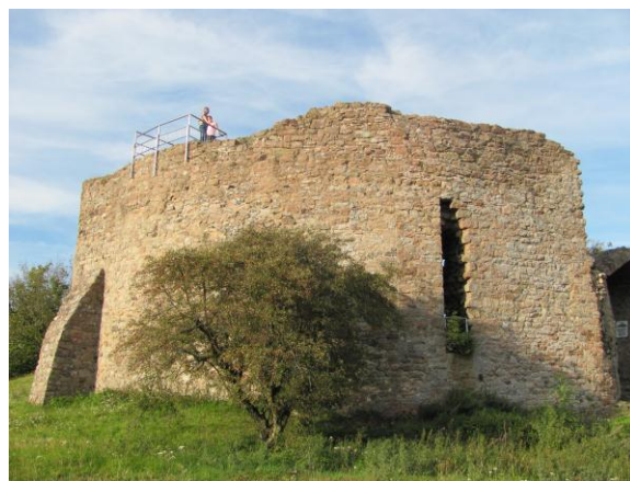
Abb. 2: Die Burgruine Frauenberg bei Beltershausen

Im Jahre 1837 führte Gerling zum Abschluss der kurhessischen Haupttriangulation eine bemerkenswerte astronomische Längendifferenzbestimmung zwischen den „großen“ Sternwarten in Göttingen (Beobachter: Dr. Goldschmidt, Assistent bei C. F. Gauß) und Mannheim (Beobachter: Friedrich Bernhard Nicolai) durch ([1] GERLING 1838). Für diese Messung hatte Gerling auf dem Plateau des südöstlich von Marburg gelegenen Frauenberges bei Beltershausen einen mächtigen steinernen Beobachtungspfeiler für sein transportables Passageinstrument errichten lassen (siehe Abbildung 3).