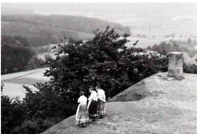
Abb. 7: Foto vom Frauenberg aus der Zeit um 1935 – rechts der Gerling'sche Steinpfeiler aus südwestlicher Richtung gesehen